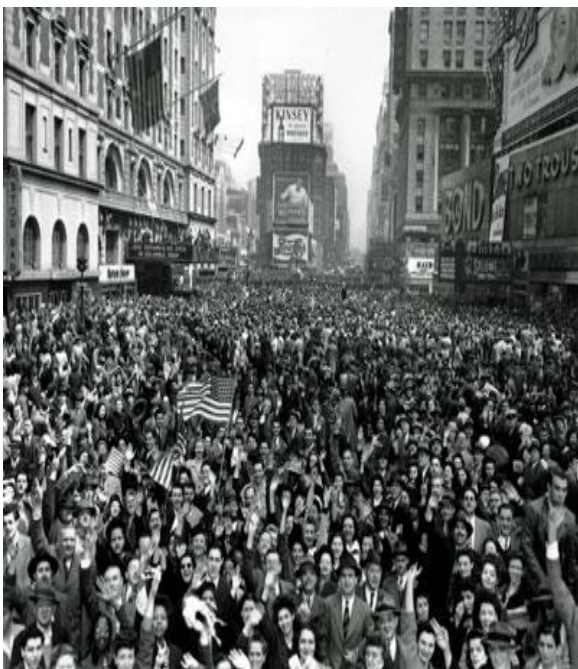
Times Square am 14. August 1945

Das Bild entstand am Tag der bedingungslosen Kapitulation Japans im Zweiten Weltkrieg. Er ist in den USA auch als „Victory-over-Japan Day“, beziehungsweise kurz V-J-Day bekannt. Diese Kapitulation 1 hatte das Ende des Zweiten Weltkrieges zur Folge.